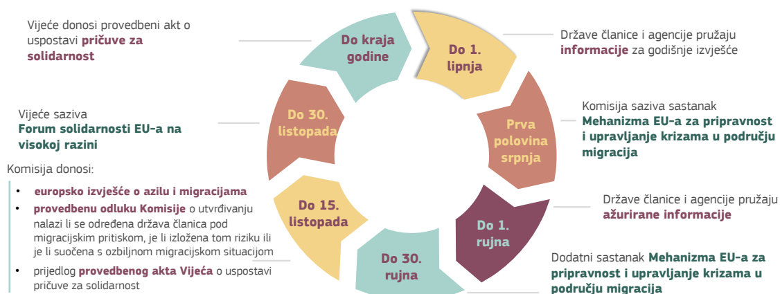
Slika 3.: Godišnji ciklus upravljanja migracijama

Na razini Unije potrebno je donijeti mnoge mjere za provedbu godišnjeg ciklusa solidarnosti. Komisija će obaviti odgovarajuće radnje za prvi godišnji ciklus upravljanja migracijama , a poduzima i sve potrebne pravne, administrativne i operativne mjere za uredno funkcioniranje svakog koraka godišnjeg ciklusa, uključujući operacionalizaciju prve godišnje pričuve za solidarnost koju Vijeće mora uspostaviti krajem 2025.