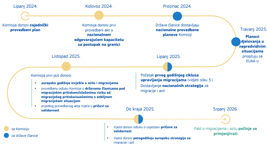
Slika 1.: kronologija ključnih etapa dvogodišnjeg provedbenog razdoblja

Treće, i dalje je neophodno nastaviti raditi na vanjskoj dimenziji migracija. Iako mjere u tom području nisu uvjetovane pravnim obvezama, vrlo je bitno da Unija nastavi i intenzivira suradnju s partnerskim zemljama, posebice u tri glavna područja: borbi protiv krijumčarenja migranata, djelotvornom vraćanju, ponovnom prihvatu i reintegraciji te zakonitim načinima dolaska.